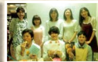
09/14 日本 「季節のパフェ」