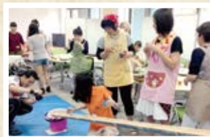
07/12 日本 「流しそうめん」