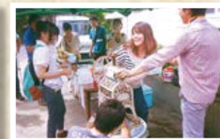
08/22 日本 「かき氷」