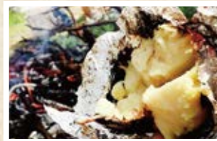
02/21 日本 「焼き芋」