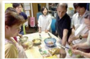
09/13 バングラデシュ 「チキンカレー」