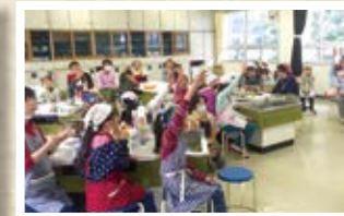
01/30 台湾 「ツォンヨウビン(台湾葱焼き餅)」