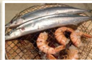
10/24 日本 「サンマ」