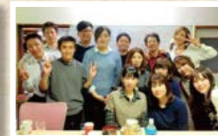
11/08 韓国「ダットリタン(鶏鍋)、 ビビンマンドゥ(混ぜ餃子)」