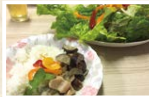
12/06 タイ 「グリーンカレー」