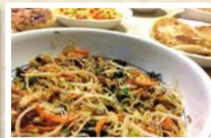
07/26 中国 「焼きビーフン、ピン(餅)」