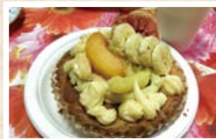
09/28 日本 「季節のタルト」