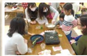
02/28 台湾 「ダンピン(台湾クレープ)」