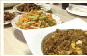
08/23 インドネシア 「ナシゴレン(焼き飯)」