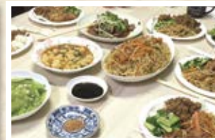
12/18 台湾 「ルーローファン(台湾そばろ井)」